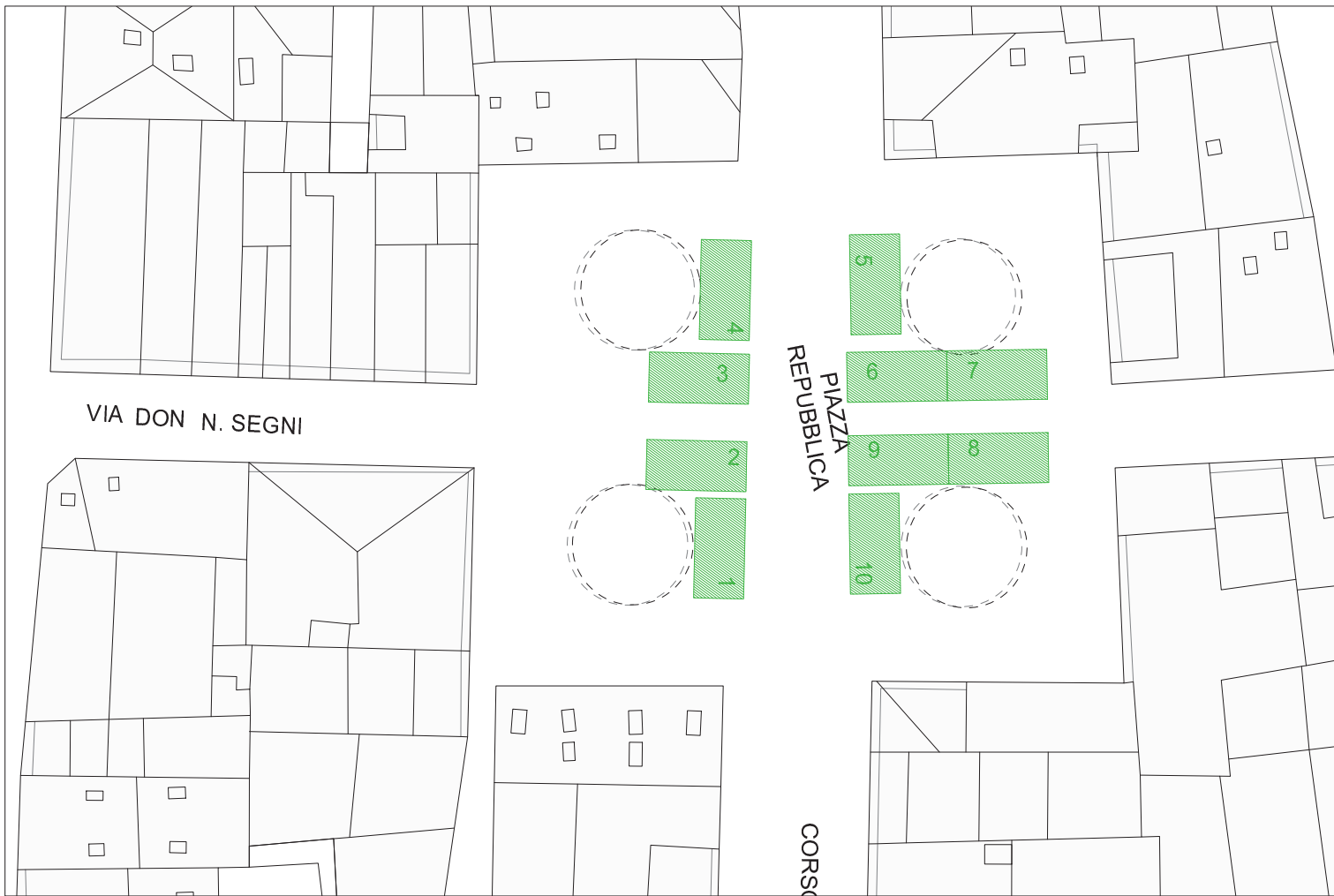
Planimetria Mercatino delle Pulci_A3_Scala 1:200