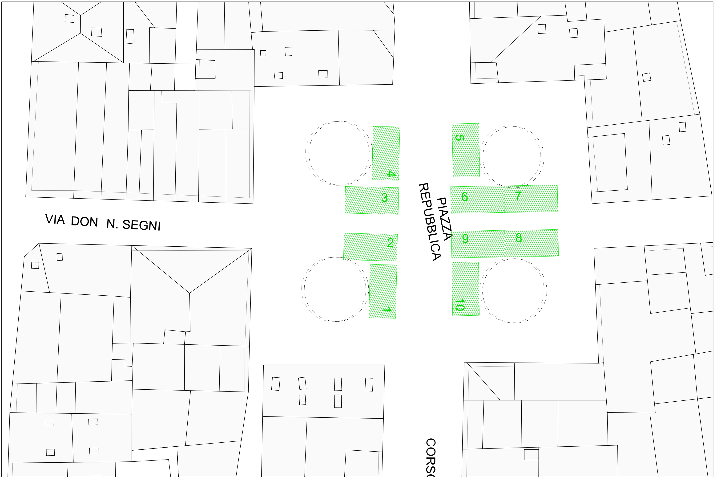
Allegato D1 _Planimetria Mercatino delle Pulci_A3_Scala 1:200